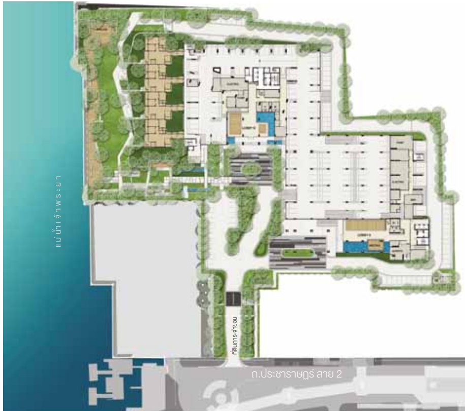
N. 1st FLOOR