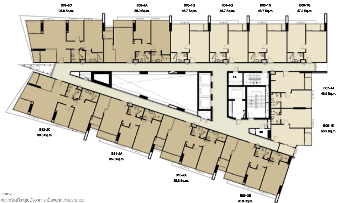
7th-42nd FLOOR N.

หมายเหตุ : 1. ขนาดห้องที่ระบุในผังอาคาร เป็นขนาดโดยประมาณ 2. ผังอาคาร B อาจมีการเปลี่ยนแปลง บริเวณชั้นใต้ดินมีโพลี-ลิฟท์ของโดยไมเกรทขอต่ออาคารวางห้องชุด 3. บริษัทฯ ขอสงวนสิทธิ์ในการเปลี่ยนแปลงรายละเอียด โดยไม่ต้องแจ้งให้ทราบล่วงหน้า