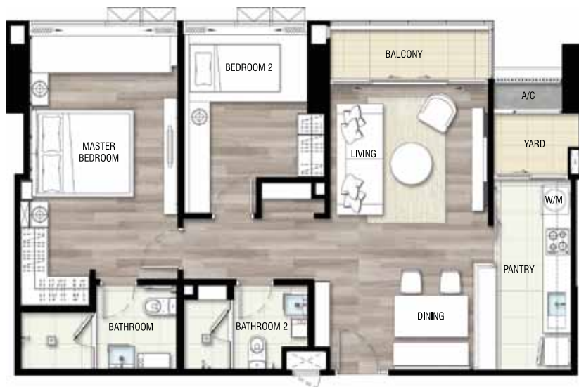
TYPE 2A 85.7 - 86.1 sq.m.