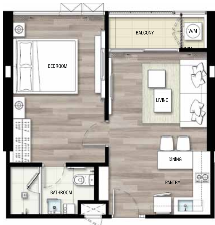
TYPE 1A 45.5 - 46.8 sq.m.