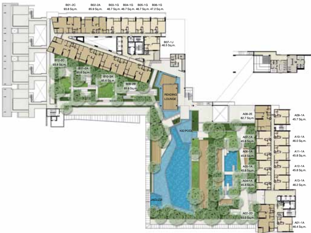
N. 5th FLOOR

หมายเหตุ : 1. ขนาดห้องที่ระบุในผังอาคาร เป็นขนาดโดยประมาณ 2. ผังอาคาร B อาจมีการเปลี่ยนแปลง บริเวณชั้นใต้ดินมีโพลี-ลิฟท์ของโดยไมเกรทขอต่ออาคารวางห้องชุด 3. บริษัทฯ ขอสงวนสิทธิ์ในการเปลี่ยนแปลงรายละเอียด โดยไม่ต้องแจ้งให้ทราบล่วงหน้า